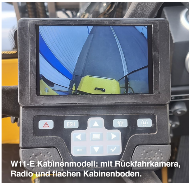
W11-E Kabinenmodell: mit Rückfahrkamera, Radio und flachen Kabinenboden.

Durch fast unbegrenzte Möglichkeiten an Anbaugeräten, sind die Eurotrac Hoflader echte Allrounder . Mit dem extra Hydraulikkreislauf können auch Funktionsgeräte wie Greifschaufeln, hydraulisch verstellbare Schneeschilder oder Ballengreifer problemlos betrieben werden.